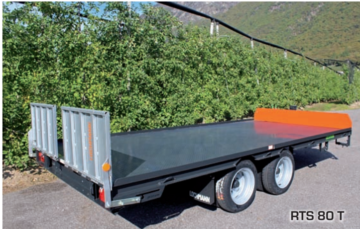
RTS 80 T