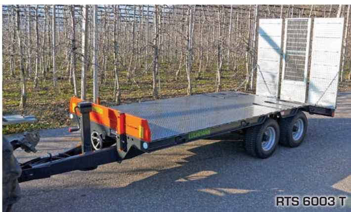
RTS 6003 T