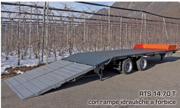
RTS 14.70 T con rampe idrauliche a forbice