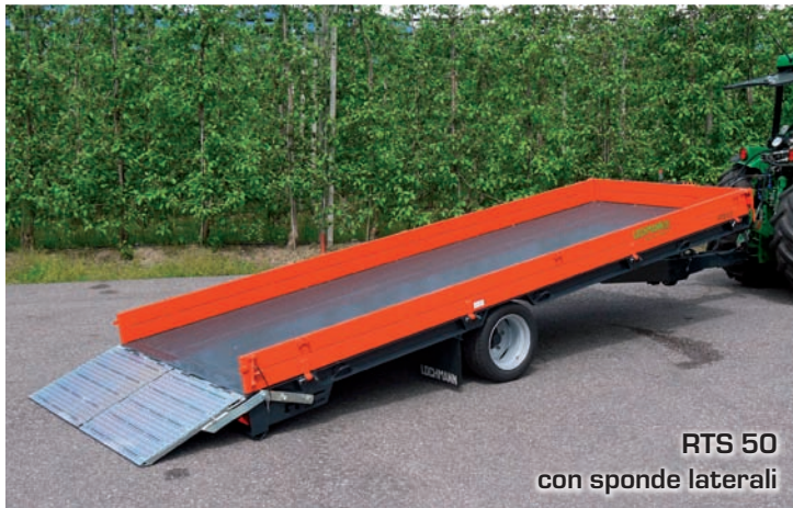
RTS 50 con sponde laterali