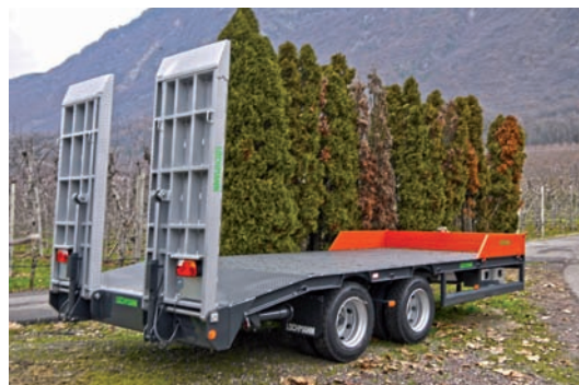
RTS 14.75 T con inclinatura posteriore