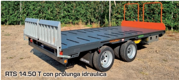
RTS 14.50 T con prolunga idraulica