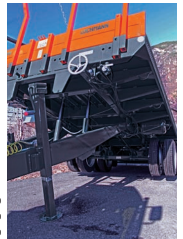
Telaio robusto costruito in acciaio