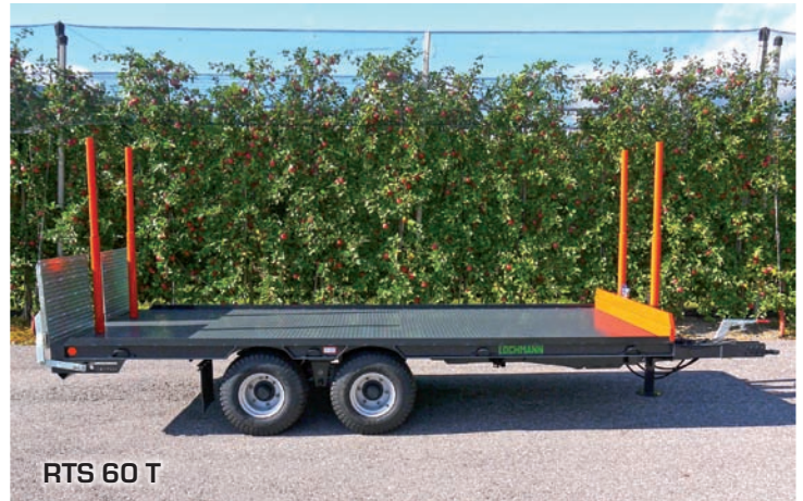
RTS 60 T