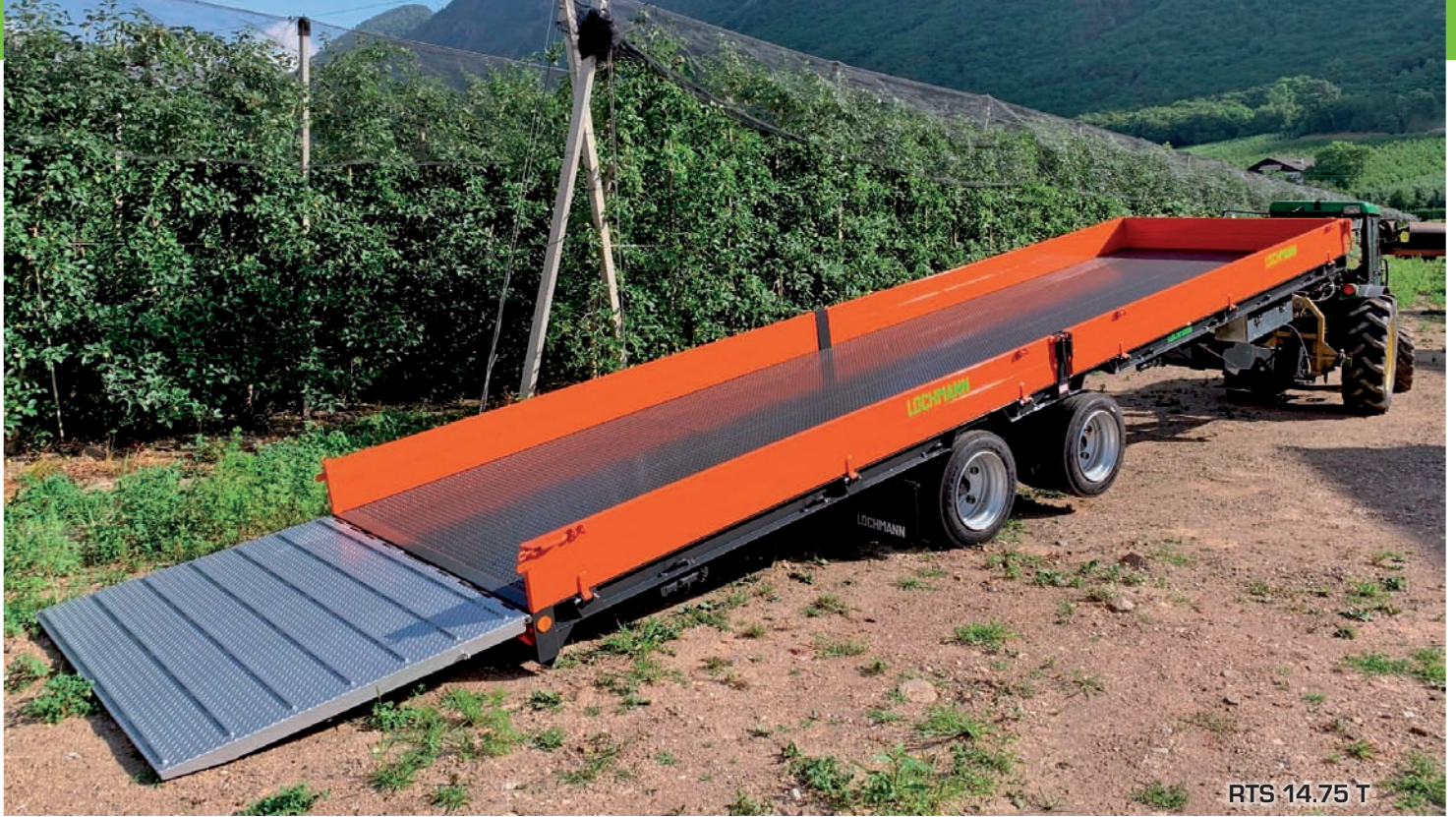
RTS 14.75 T