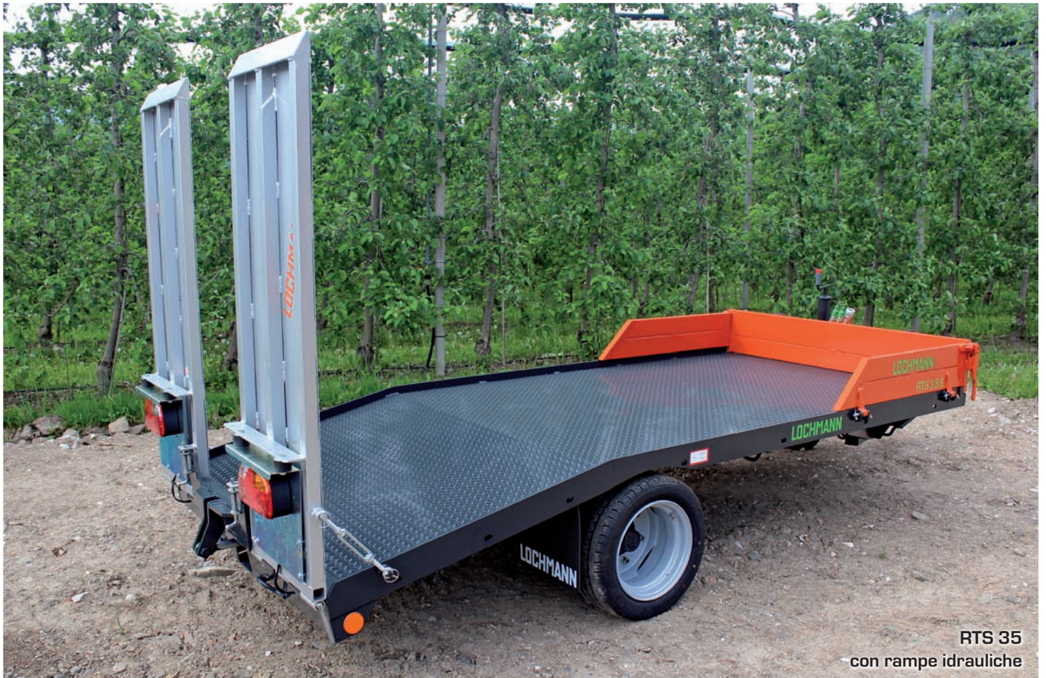
RTS 35 con rampe idrauliche