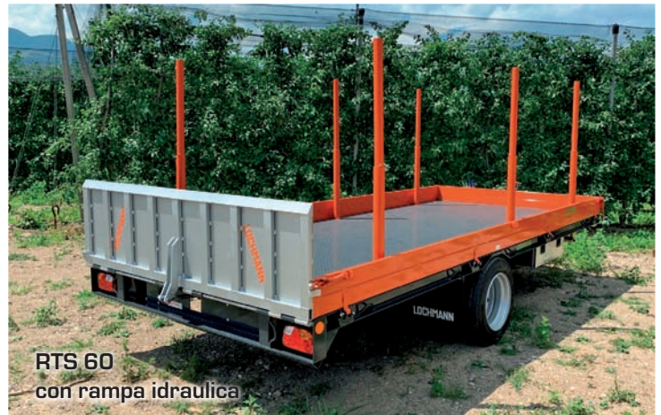
RTS 60 con rampa idraulica