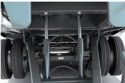
Due pistoni a doppio effetto di serie (da RTS 10.46 T)