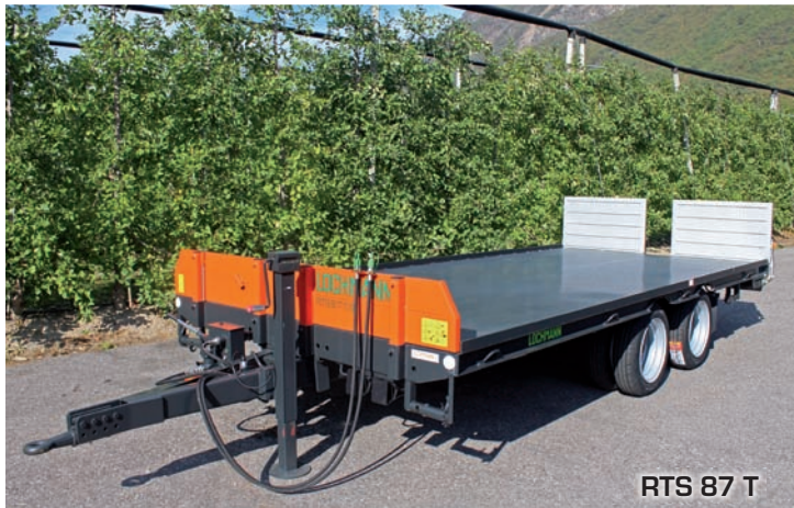
RTS 87 T