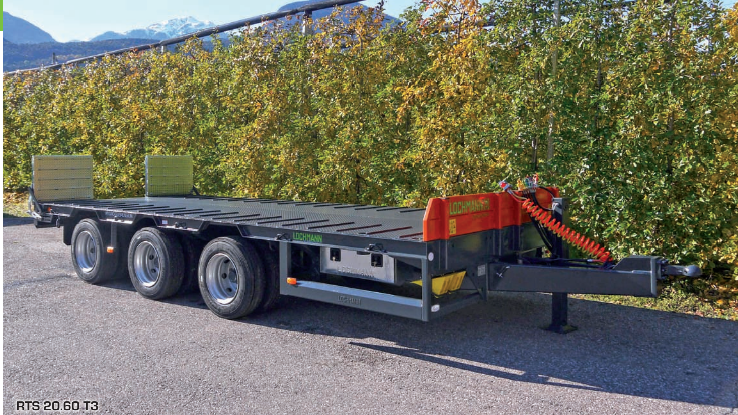
RTS 20.60 T3