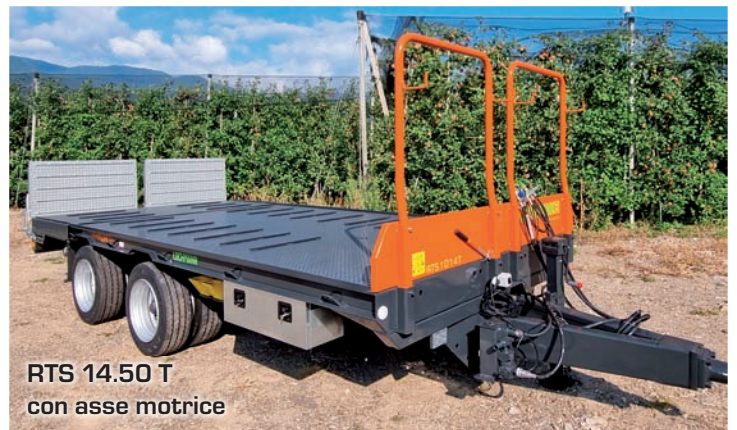
RTS 14.50 T con asse motrice