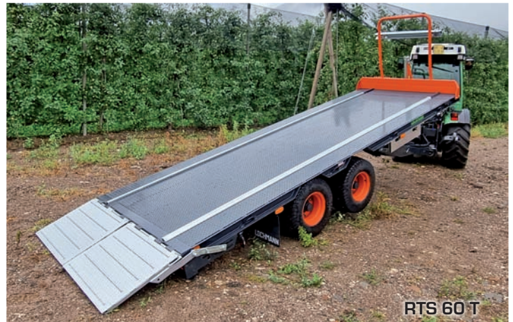
RTS 60 T