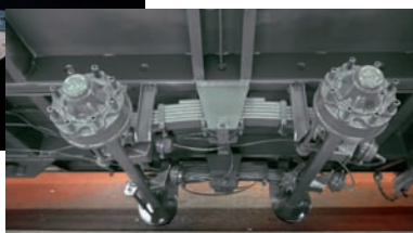
Sospensione tandem oscillante e balestrata