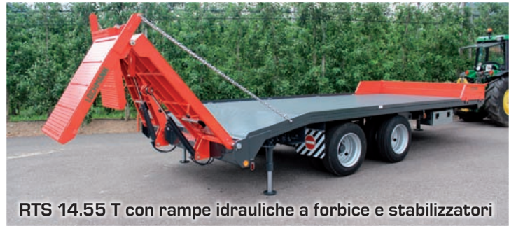
RTS 14.55 T con rampe idrauliche a forbice e stabilizzatori