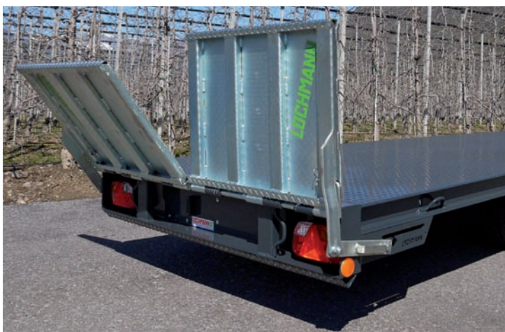
Rampe con arresto rapido di serie