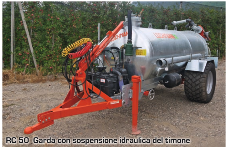
RC 50 Garda con sospensione idraulica del timone