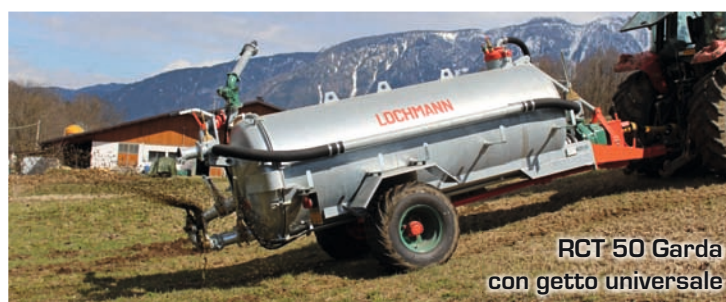
RCT 50 Garda con getto universale