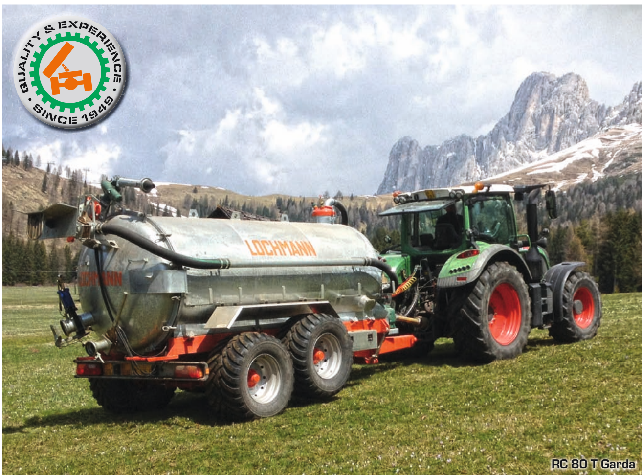
RC 80 T Garda