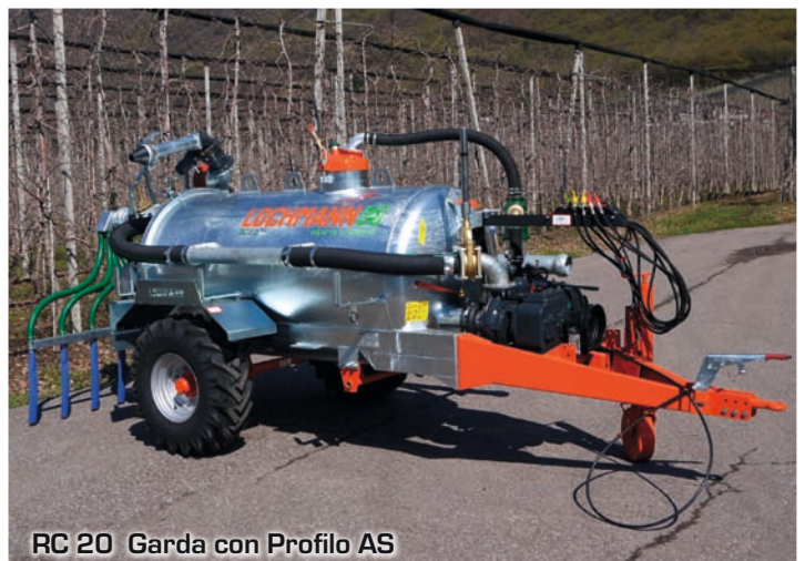
RC 20 Garda con Profilo AS