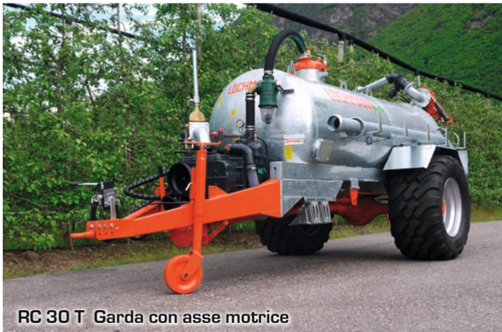
RC 30 T Garda con asse motrice