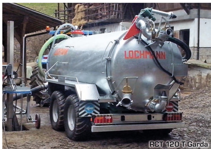
RCT 120 T Garda