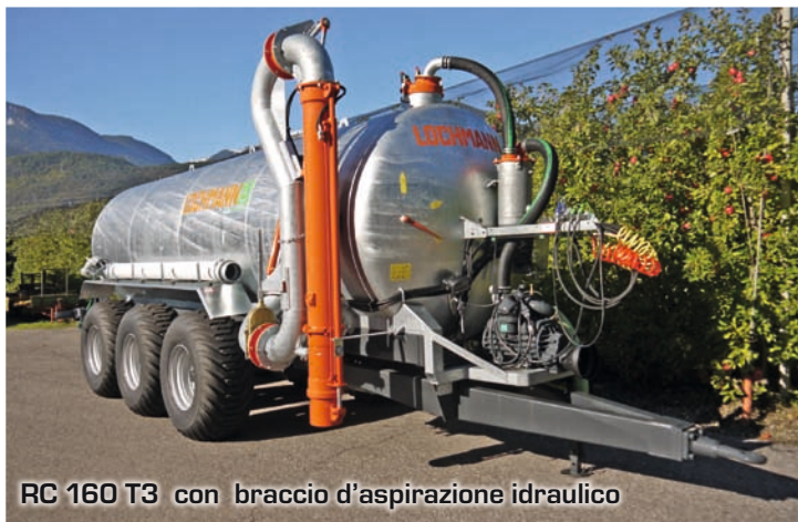
RC 160 T3 con braccio d'aspirazione idraulico