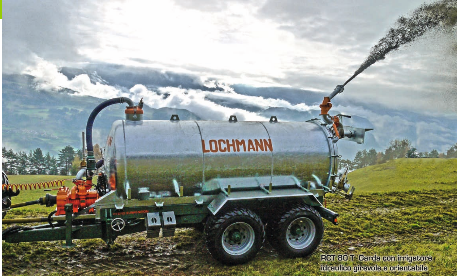
RCT 80 T Garda con irrigatore idraulico girevole e orientabile