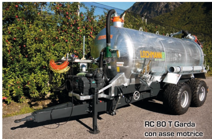
RC 80 T Garda con asse motrice