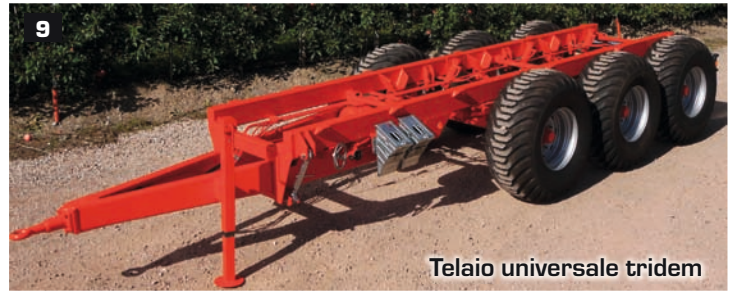
Telaio universale tridem