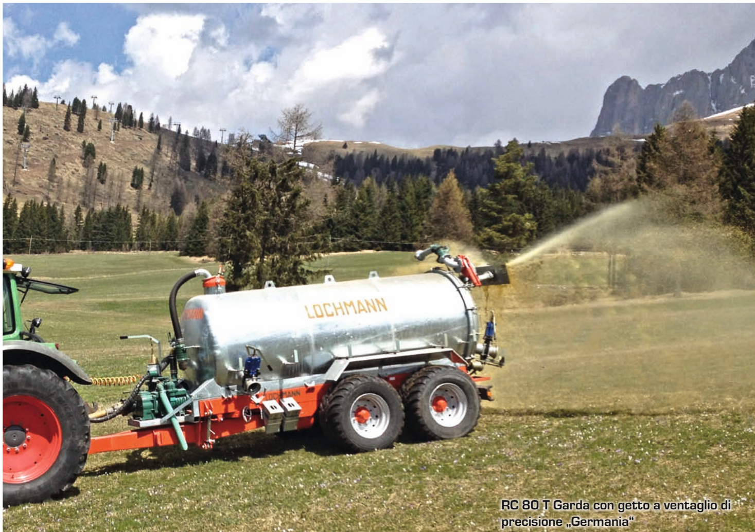
RC 80 T Garda con getto a ventaglio di precisione „Germania“