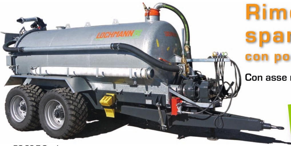
RC 80 T Garda