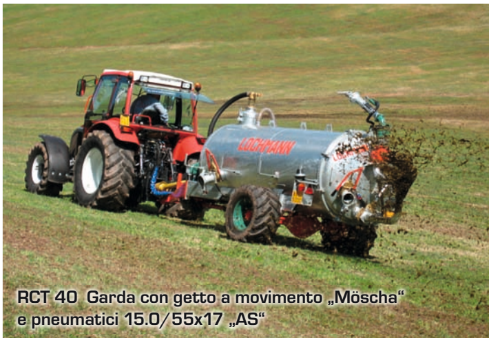
RCT 40 Garda con getto a movimento „Möscha“ e pneumatici 15.0/55x17 „AS“