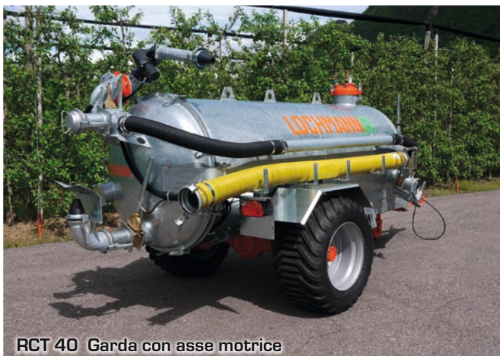
RCT 40 Garda con asse motrice