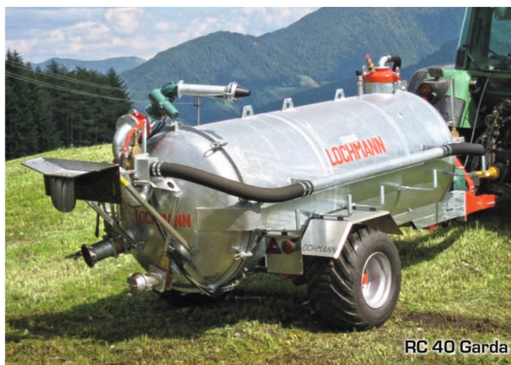
RC 40 Garda