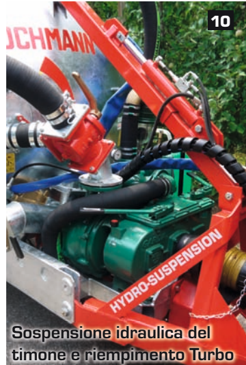
Sospensione idraulica del timone e riempimento Turbo