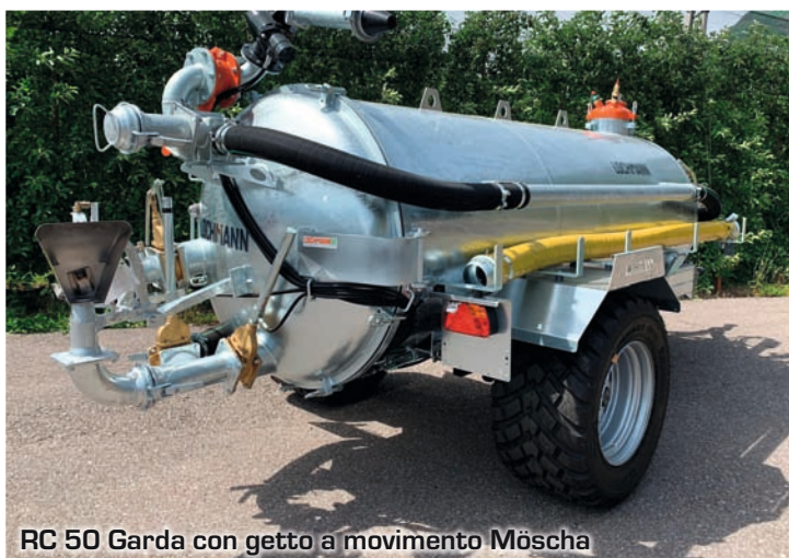
RC 50 Garda con getto a movimento Möscha