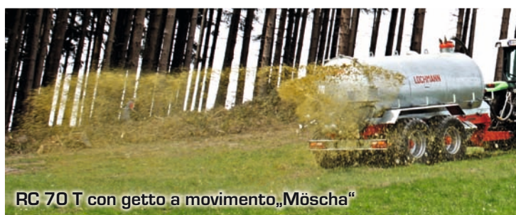
RC 70 T con getto a movimento „Möscha“

Un altro risultato di molti decenni di esperienza nella tecnologia dei liquami è il box di distribuzione centrale sul retro della cisterna . In questo modo è possibile utilizzare la pompa centrifuga non solo per la distribuzione del liquame tramite l'irrigatore, ma anche tramite vari distributori. La pressione della pompa centrifuga e quindi anche l' ampiezza di spandimento e la concentrazione del liquame possono essere regolate a seconda delle esigenze tramite la velocità della presa di forza. Numerose funzioni idrauliche possono essere comodamente controllate dalla cabina del trattore, a tutto vantaggio della sicurezza sul lavoro.