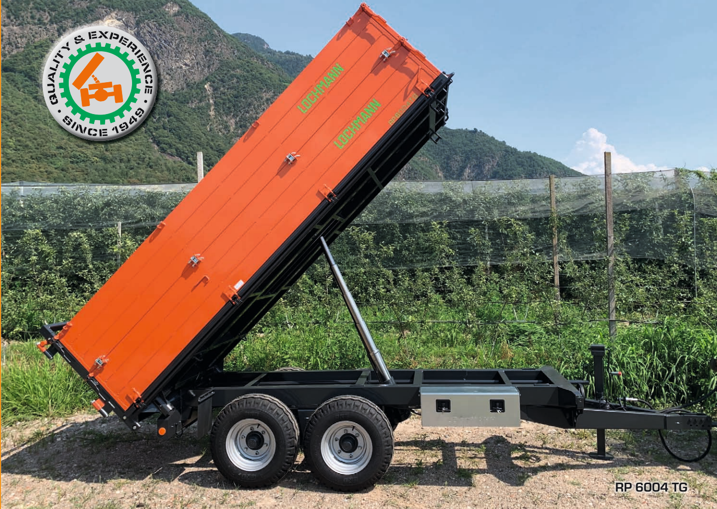
RP 6004 TG