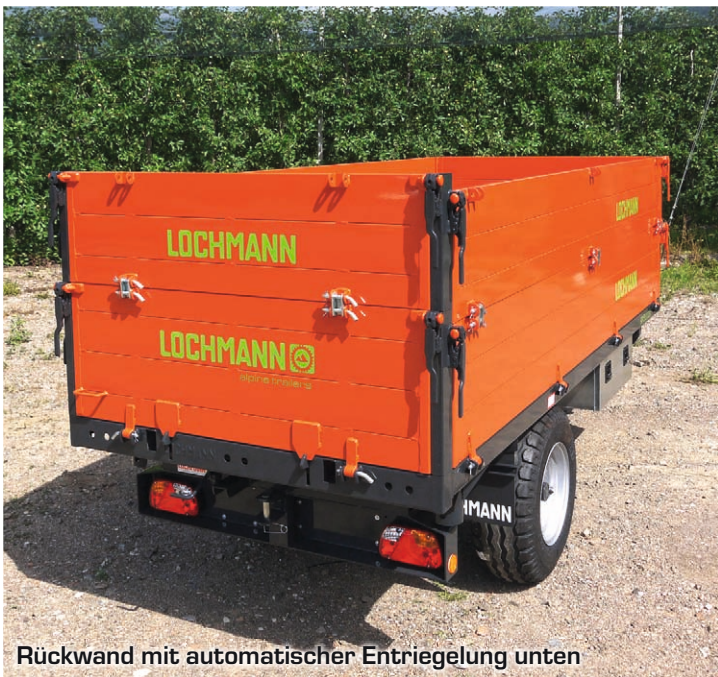
Rückwand mit automatischer Entriegelung unten