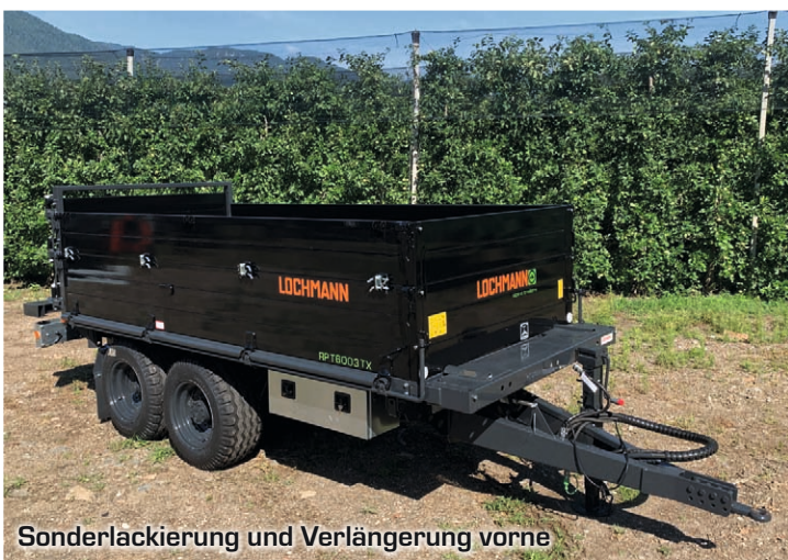
Sonderlackierung und Verlängerung vorne