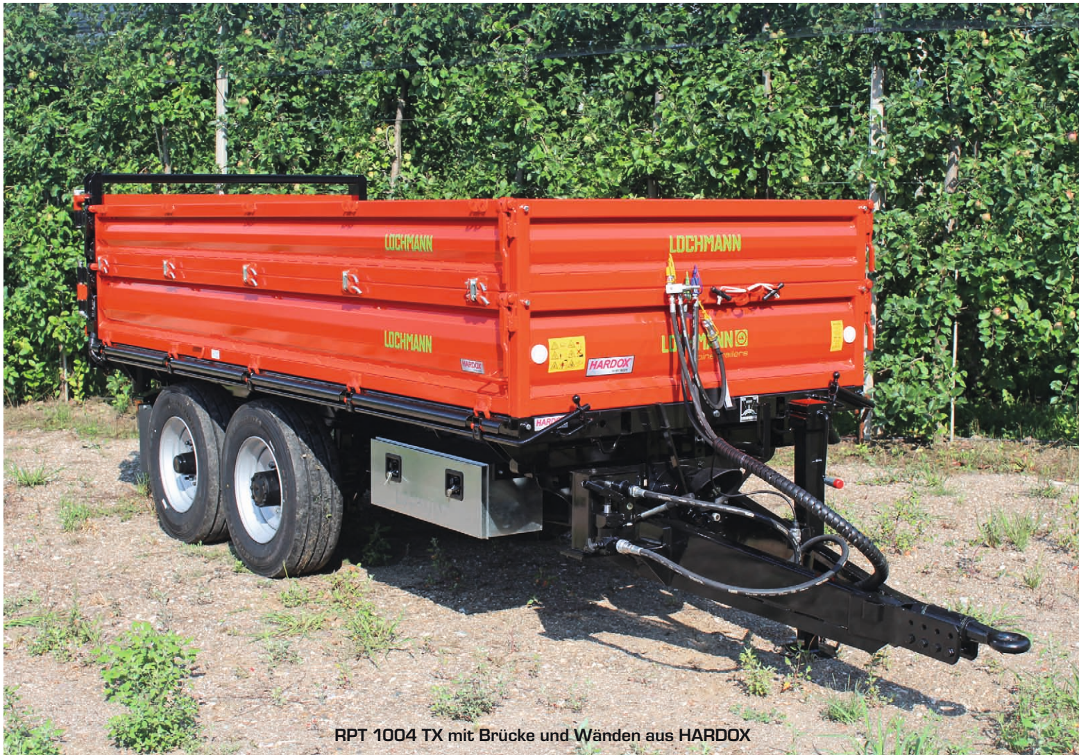
RPT 1004 TX mit Brücke und Wänden aus HARDOX