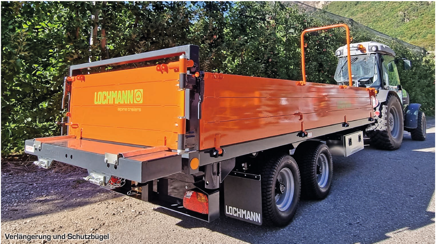
Verlängerung und Schutzbügel