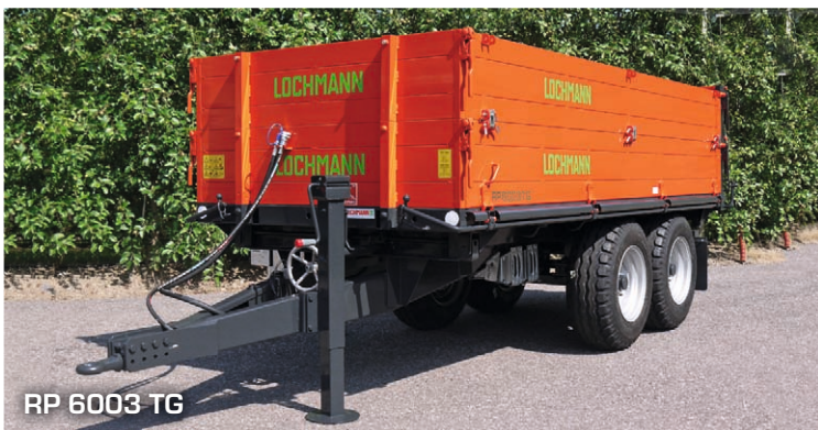
RP 6003 TG