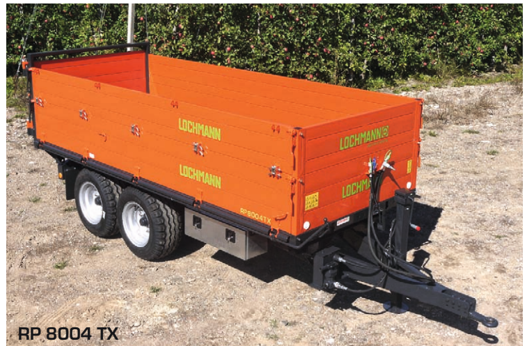
RP 8004 TX

Zur Erhöhung der Sicherheit und des Fahrkomforts haben wir neue "Cantilever"-Tandemachsen mit untenliegenden zentralen Pendelbolzen entwickelt. Dadurch befinden sich Achsmittelpunkt und zentraler Pendelbolzen in einer Linie, wodurch eine höhere Stabilität und eine bessere Gewichtsverteilung auch im Bremsvorgang erreicht wird. Zusätzlich sind unsere Schmalspur-Anhänger mit mechanischen Achsführungen ausgestattet, welche das Verschieben der Achsen bei extremen Kurvenfahrten verhindern und eine genauere Spurstabilität gewährleisten.