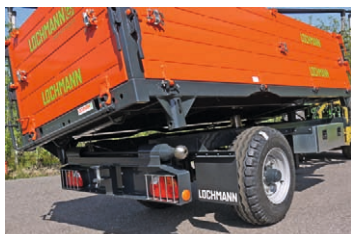
Starke Kugel-Kipplager mit integrierten Kippmatik (Patentiert)