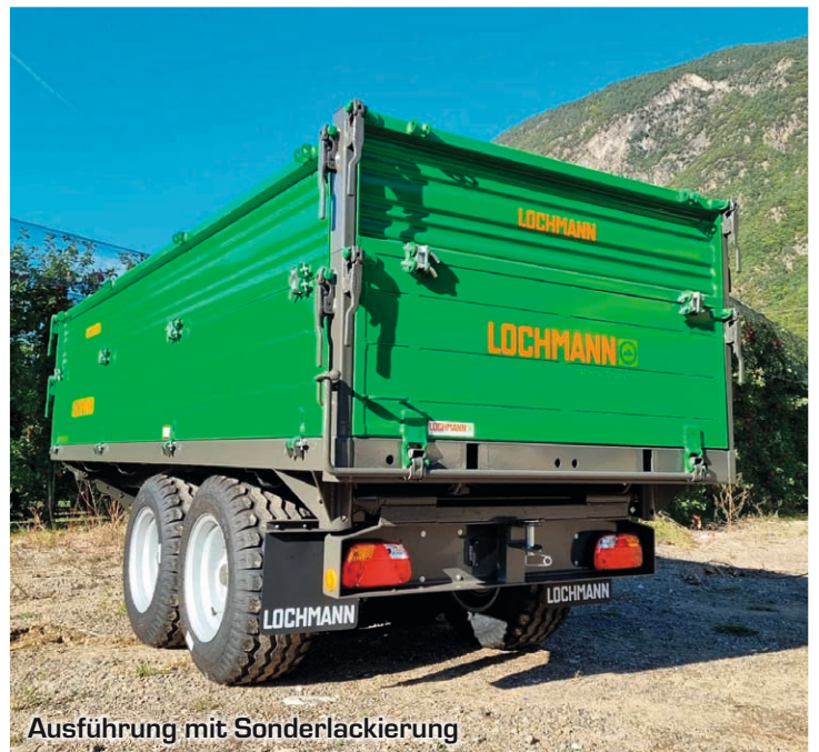
Ausführung mit Sonderlackierung