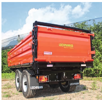
Rückwand seitlich zu öffnen

Spezial-Bordwandverschlüsse mit automatischer Sicherung. Bordwand-Scharniere mit abnehmbaren Pendelbolzen. Großer Kippwinkel und weit hinten angebrachte Kipplager ermöglichen eine große Abschutthöhe Kipp-Hubbegrenzungsventil