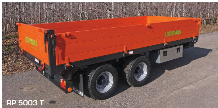
RP 5003 T