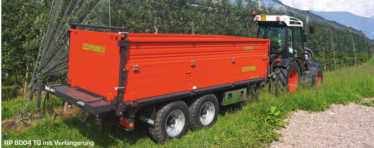
RP 8004 TG mit Verlängerung