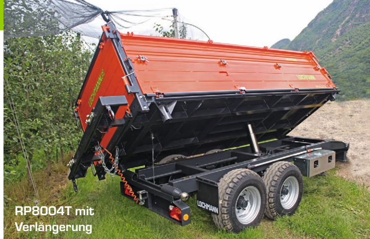
RP8004T mit Verlängerung