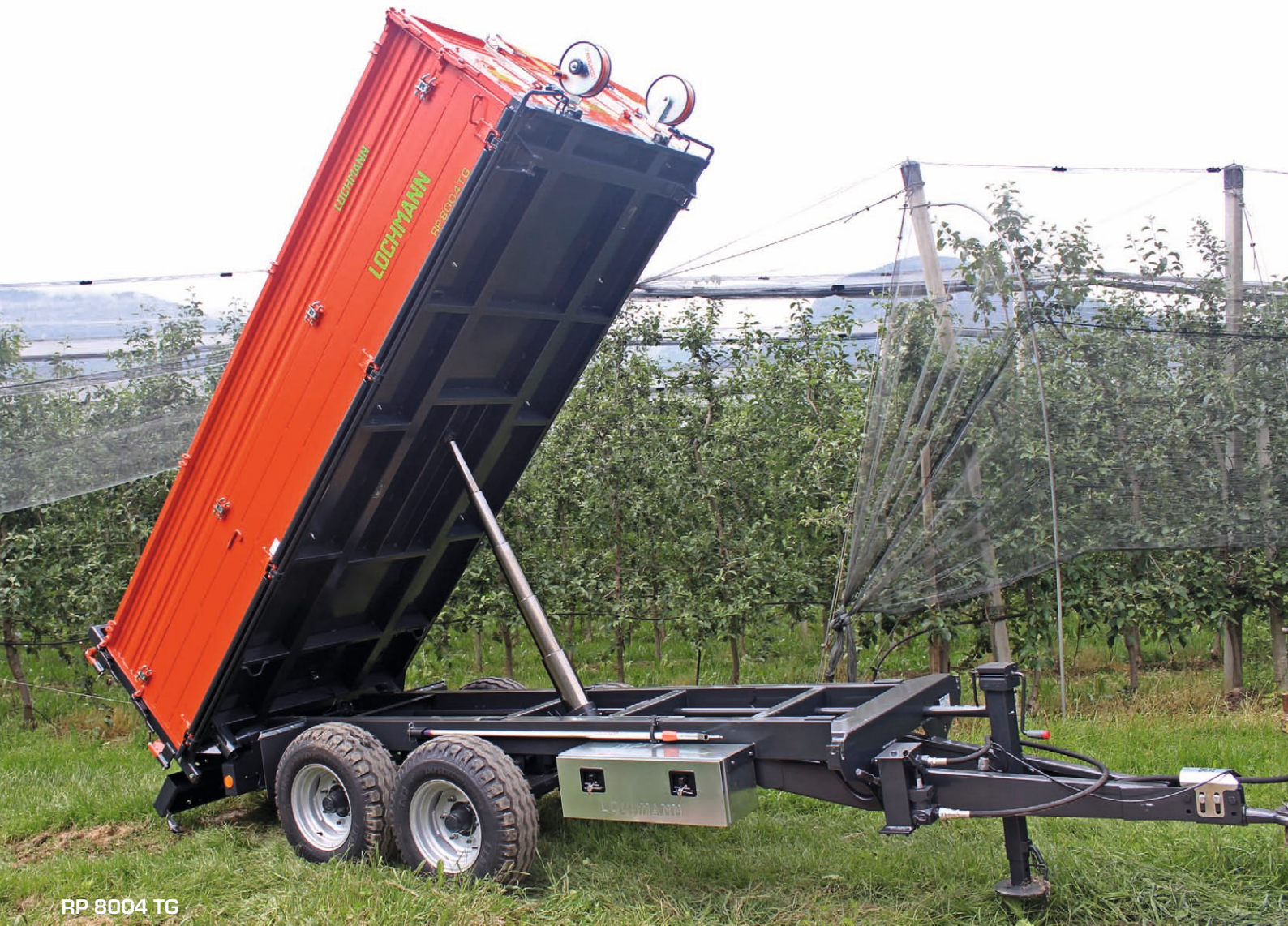
RP 8004 TG