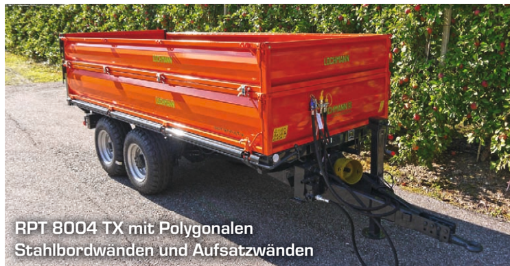
RPT 8004 TX mit Polygonalen Stahlbordwänden und Aufsatzwänden