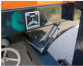
KIPPMATIK, zentralisierte Kipplagersteuerung (Patentiert)