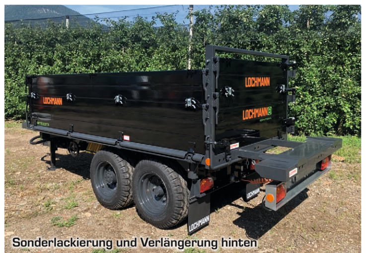
Sonderlackierung und Verlängerung hinten