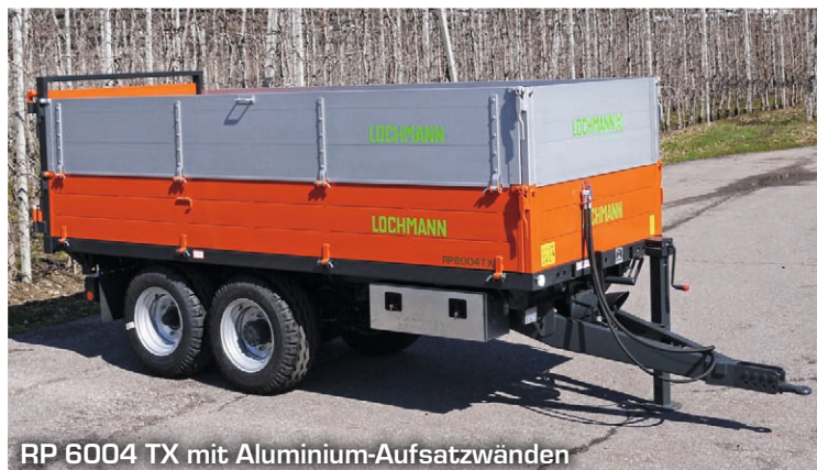
RP 6004 TX mit Aluminium-Aufsatzwänden