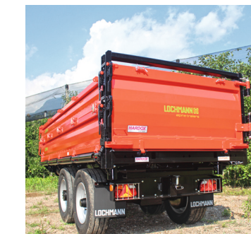
Sponda posteriore apribile di lato

Valvola idraulica di fine corsa del ribaltabile.