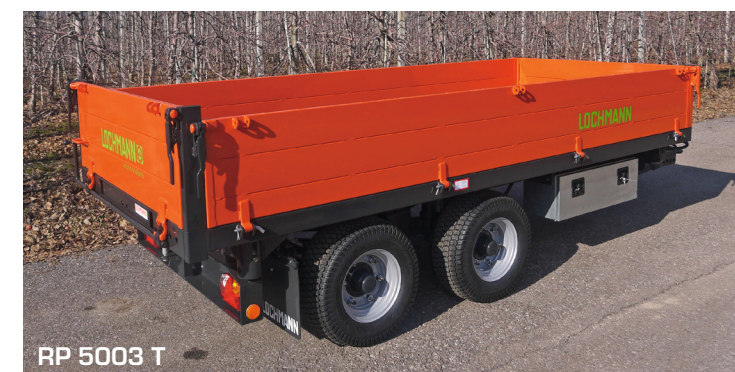
RP 5003 T