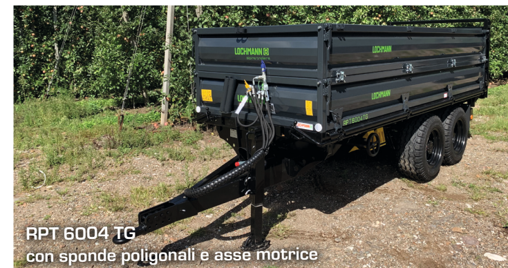
RPT 6004 TG con sponde poligonali e asse motrice