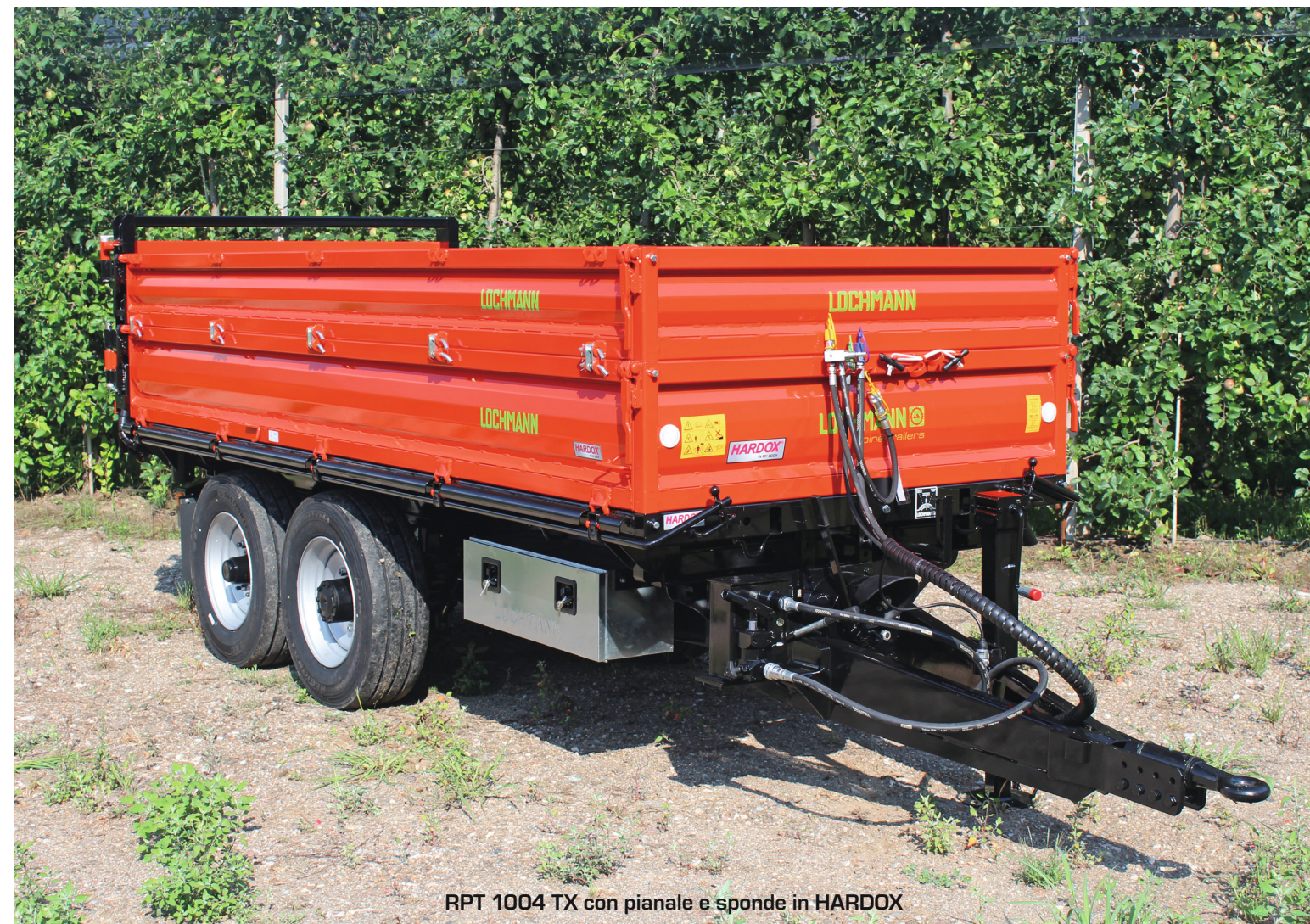
RPT 1004 TX con pianale e sponde in HARDOX