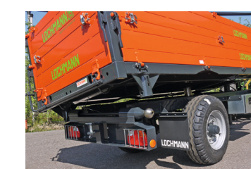
Robuste cerniere a sfera per ribaltamento con Kippmatic integrato

entrambi saldati su innovativi impianti robotizzati, si prestano anche per trasporti estremamente impegnativi.