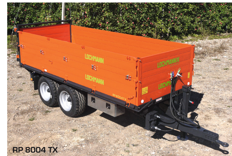
RP 8004 TX

Inoltre gli assali sono dotati di guide meccaniche, che impediscono lo spostamento dell'asse in sterzate strette, aumentando la stabilità di marcia.