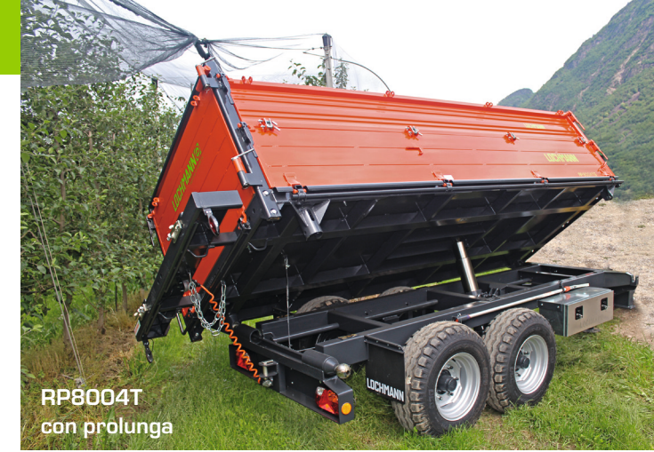
RP8004T con prolunga