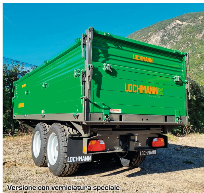
Versione con verniciatura speciale