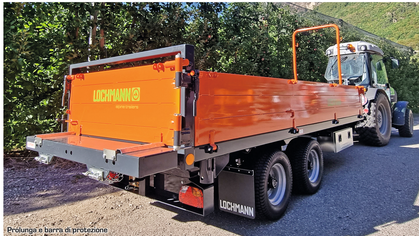
Prolunga e barra di protezione