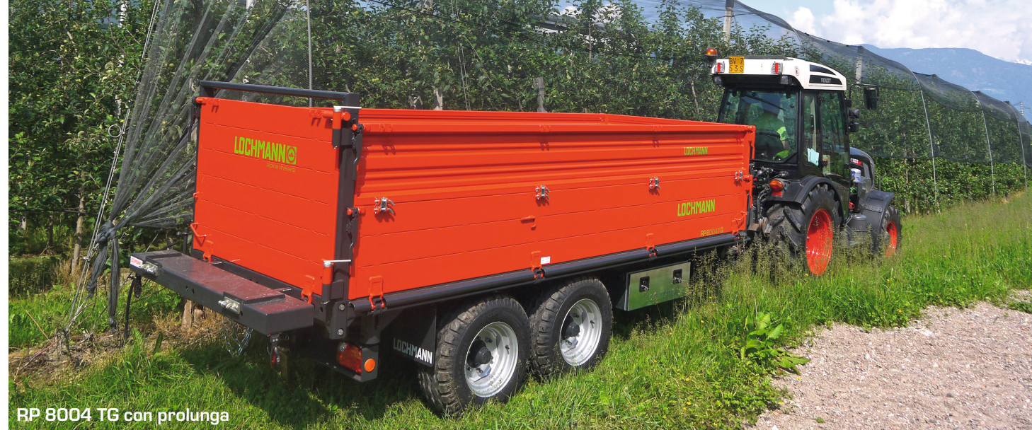
RP 8004 TG con prolunga