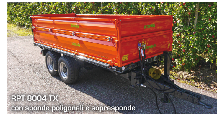
RPT 8004 TX con sponde poligonali e soprasponde