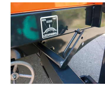
KIPPMATIC, comando centrale del ribaltabile. (brevettato)

KIPPMATIC = comando centrale del ribaltabile