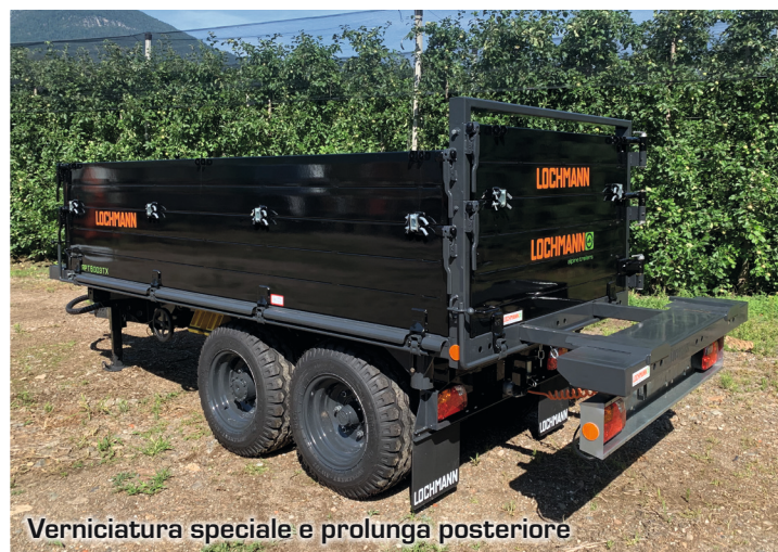
Verniciatura speciale e prolunga posteriore