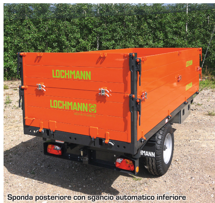
Sponda posteriore con sgancio automatico inferiore