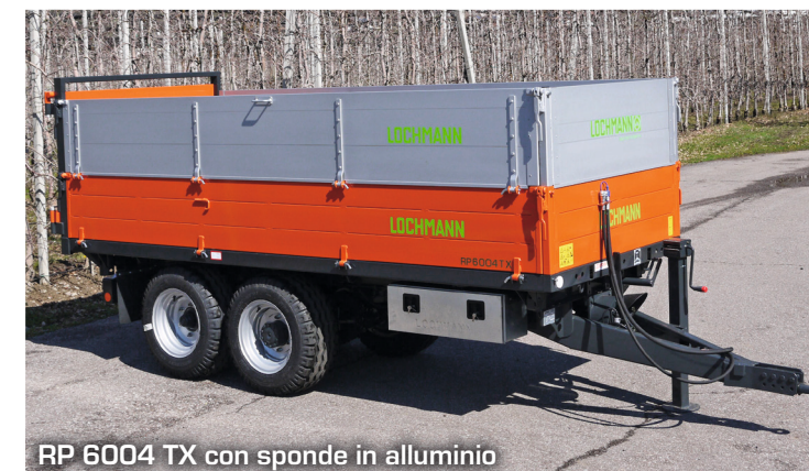
RP 6004 TX con sponde in alluminio