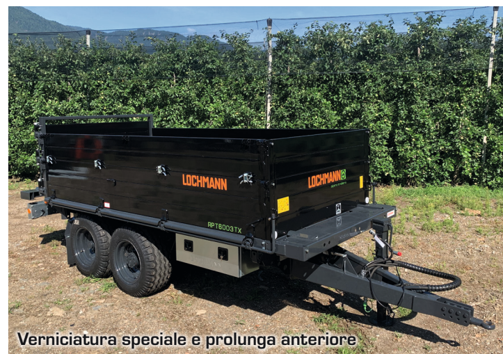
Verniciatura speciale e prolunga anteriore