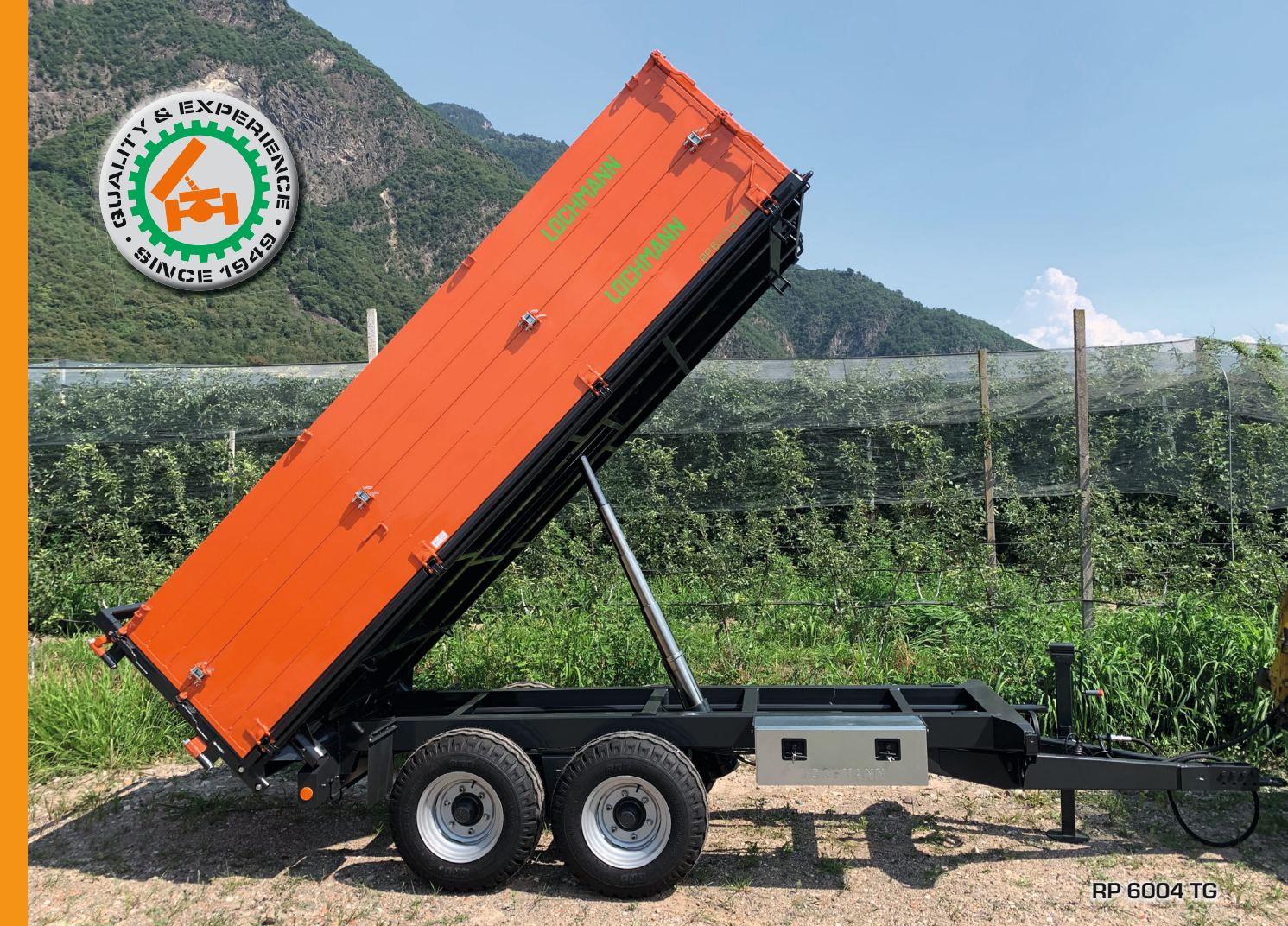
RP 6004 TG