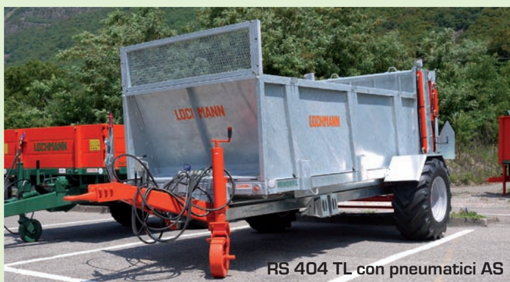
RS 404 TL con pneumatici AS