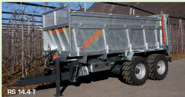
RS 14.4 T