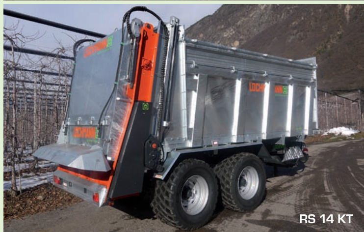
RS 14 KT