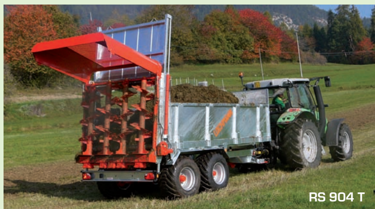
RS 904 T