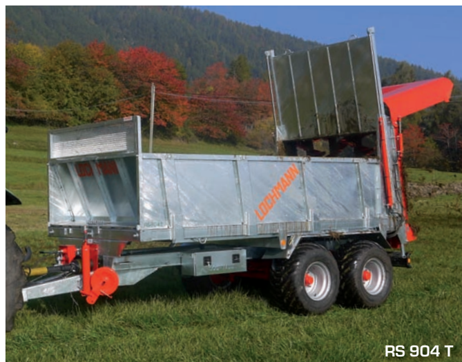
RS 904 T

Lochmann SRL I-39018 VILPIANO (BZ) Via Merano, 37 Tel. +39 0471 678630 - Fax +39 0471 678571 info@lochmann-erich.it