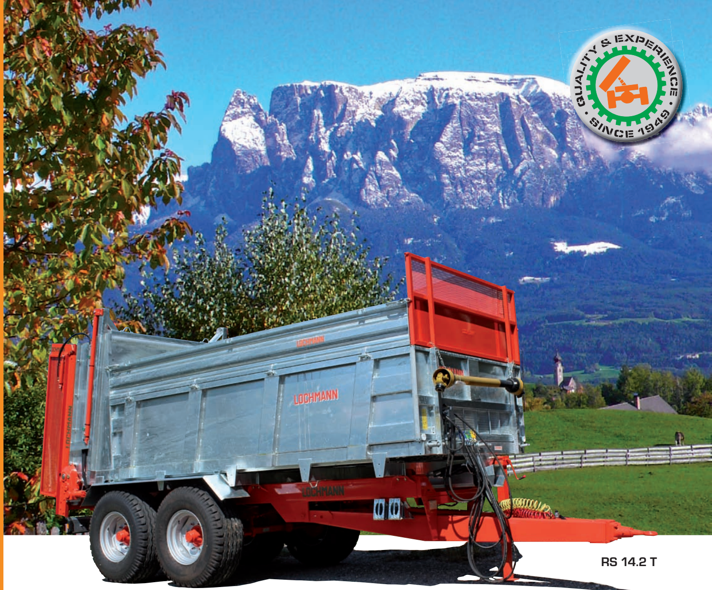
RS 14.2 T