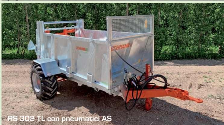
RS 302 TL con pneumatici AS